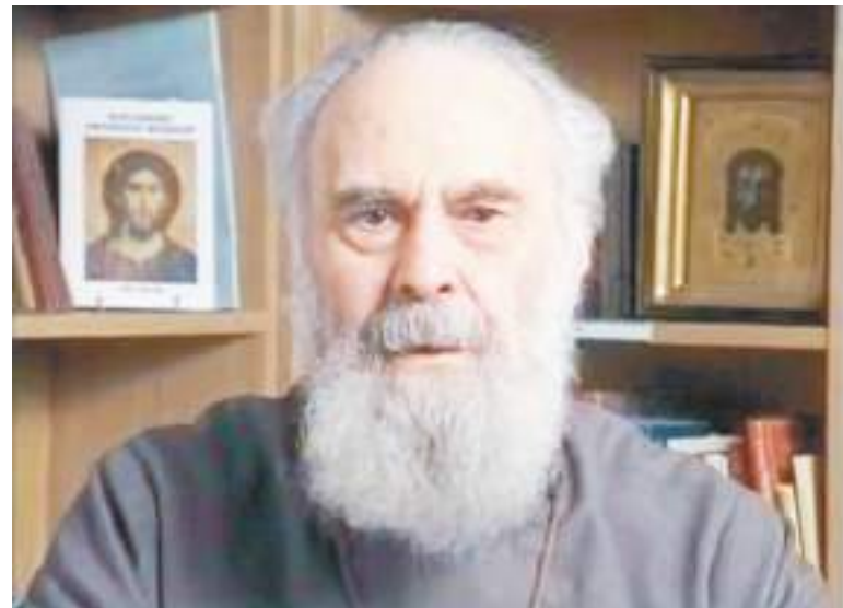
Митрополит Антоний Сурожский

И вот дальше нам дано слово, предостережение святого