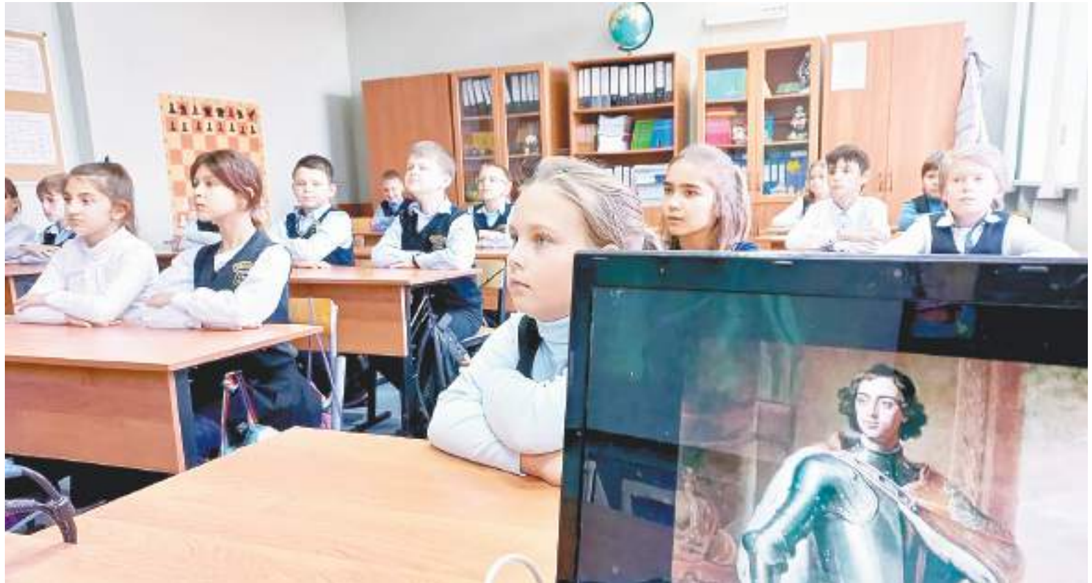
Просмотр фильма на открытии чтений

Второй старинный храм, тоже освещенный в честь Воскресения Словущего, находится в селе Кольчево. Ему более трехсот лет.