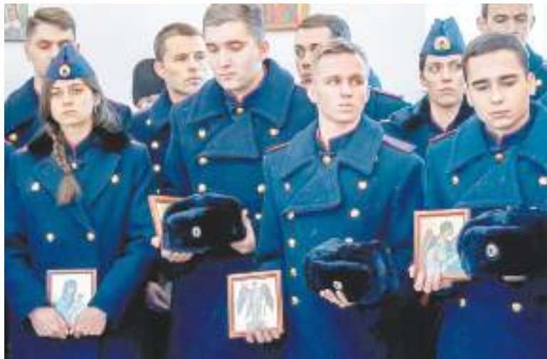
Каждый из молодых следователей получил икону

9 декабря Следственный комитет Российской Федерации отмечает памятную дату истории – День основания «Майорских следственных канцелярий», явившихся прообразом современных следственных органов Российской Федерации.