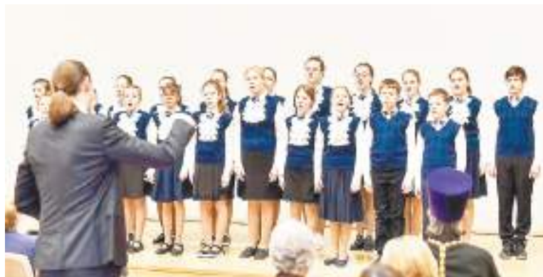
Выступление гимназического хора